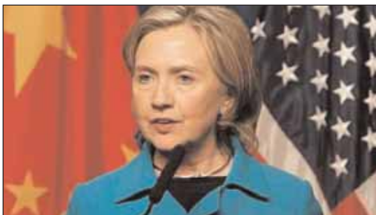
Η υπουργός Εξωτερικών των Ηνωμένων Πολιτειών, Χίλαρι Κλίντον, θα επισκεφθεί αρχές Νοεμβρίου την Αυστραλία.

Η υπουργός Εξωτερικών των Ηνωμένων Πολιτειών, Χίλαρι Κλίντον, θα πραγματοποιήσει στις αρχές Νοεμβρίου επίσημη επίσκεψη στην Αυστραλία, στα πλαίσια περιοδείας της σε χώρες της Ασίας και του Ειρηνικού.