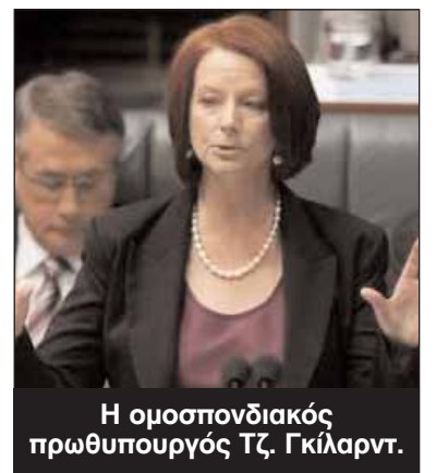
Η ομοσπονδιακή πρωθυπουργός Τζ. Γκίλαρντ.

Με βάση δύο κόμματα, η κυβέρνηση συγκεντρώνει το 49% των ψήφων και ο Συνασπισμός το 51%.