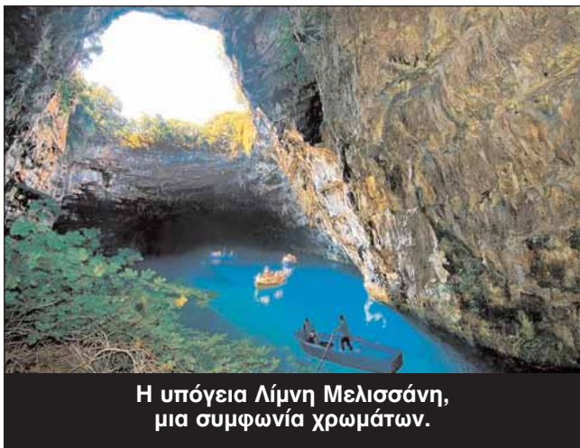
Η υπόγεια Λίμνη Μελισσάνη, μια συμφωνία χρωμάτων.