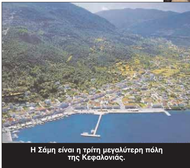
Η Σάμη είναι η τρίτη μεγαλύτερη πόλη της Κεφαλονιάς.

θηκαν από το βροχίνο νερό, το οποίο διαπερνά το πέτρωμα, το διαβρώνει και αποθέτει τα συστατικά του στην άκρη του σταλακτίτη. Ένας σταλακτίτης μεγαλώνει περίπου κατά ένα εκατοστό κάθε εκατό χρόνια. Δυστυχώς αρκετοί σταλακτίτες είναι κομμένοι, μερικοί εξαιτίας των σεισμών και άλλοι από ανθρώπινη ανοησία μπροστά σε αυτό το ανυπέροχο γλυπτό της φύσης.