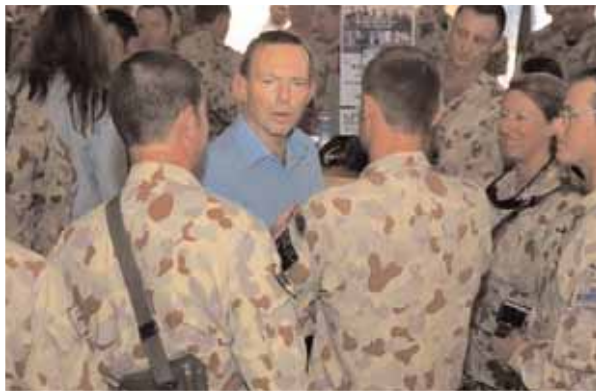
ΣΤΗ ΦΩΤΟΓΡΑΦΙΑ ο κ. Άμποτ ανάμεσα σε Αυστραλούς στρατιώτες, στο Αφγανιστάν.

Ο αρχηγός της ομοσπονδιακής αντιπολίτευσης, Τόνι Άμποτ, επέκρινε την κυβέρνηση ότι δεν πρόσφερε νομική βοήθεια σε τρεις Αυστραλούς στρατιώτες που κατηγορούνται για το θάνατο πολιτών στο Αφγανιστάν. Ο κ. Άμποτ τόνισε - κατά την επίσκεψή του στο Αφγανιστάν - ότι είναι δύσκολο να διαπιστώσεις τι ακριβώς συμβαίνει μέσα στη δίνη του πολέμου. Σημειώνεται ότι οι τρεις Αυστραλοί στρατιώτες ισχυρίζονται ότι είχαν δεχθεί επίθεση και ότι απλά ανταπέδωσαν τα πυρά.