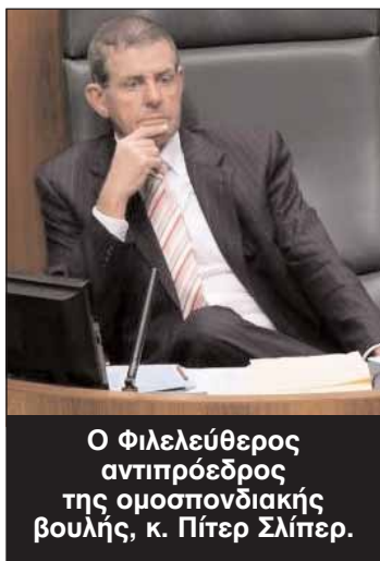
Ο Φιλελεύθερος αντιπρόεδρος της ομοσπονδιακής βουλής, κ. Πίτερ Σλίπερ.

Ο Φιλελεύθερος βουλευτής, Πίτερ Σλίπερ, που δέχθηκε να εκλεγεί αντιπρόεδρος της ομοσπονδιακής βουλής, αναγκάστηκε να επιστρέψει 14 και πλέον χιλιάδες δολάρια που κακώς είχαν χρησιμοποιηθεί για ταξιδιωτικά έξοδα της οικογένειάς του. Οι Φιλελεύθεροι πάντως διέψευσαν χθες δημοσίευμα σύμφωνα με το οποίο το κόμμα του εκδικήθηκε τον Πίτερ Σλίπερ για την αποδοχή της θέσης του αντιπροέδρου της ομοσπονδιακής βουλής.