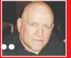
Του Γιόργου Σταυρουλάκη

ρι μας βαθιά στην τσέπη, πληρώνοντας στην ουσία την συντήρηση του γηπέδου και για την ομάδα του ράγκμπι που της παρείχαν τα πάντα δωρεάν».