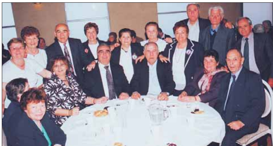
Μετά την Θεία Λειτουργία ακολούθησε γεύμα στο Λήμνος Κλαμπ από όπου και το στιγμιότυπο.