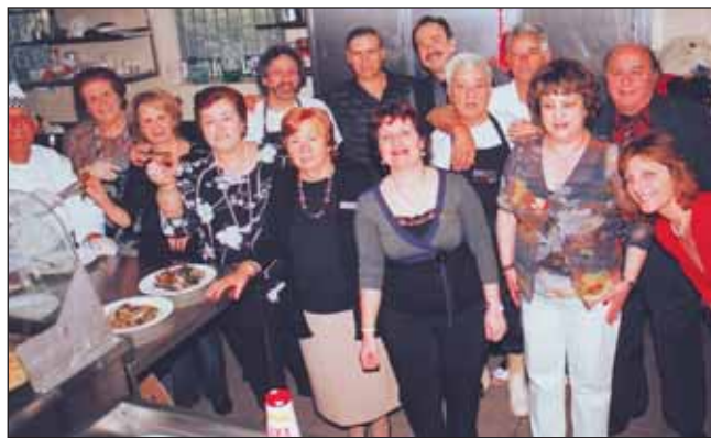
Οι κυρίες της Γυναικείας Επιτροπής στην κουζίνα.