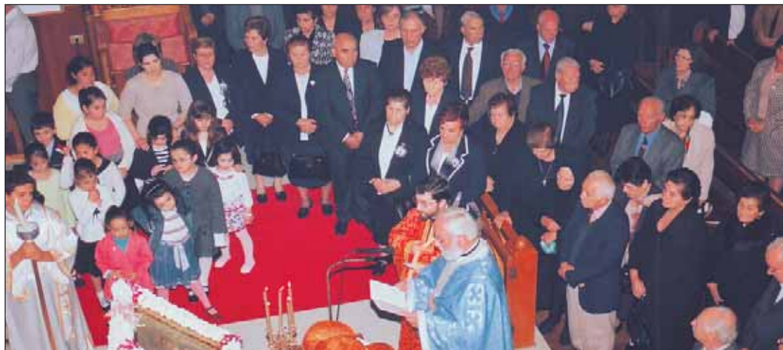
Στιγμιότυπο από τον εορτασμό του Αγίου Σώζοντος της Λημνιακής Αδελφότητας "Η Μαρούλα" την περασμένη Κυριακή στον Ιερό Ναό των Αγίων Πάντων του Μπέλμορ.