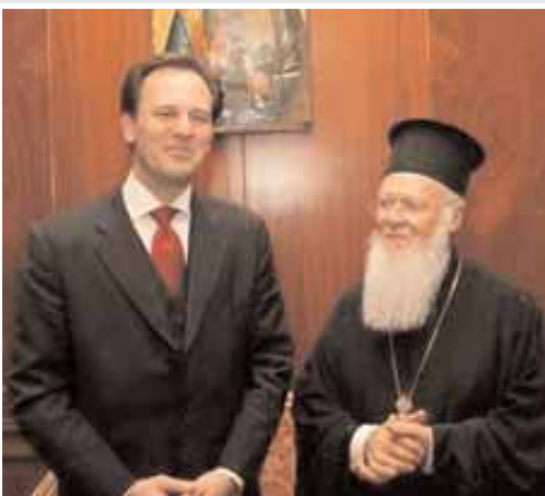
Ο Οικουμενικός Πατριάρχης με τον αναπληρωτή υπουργό Εξωτερικών.

Στην τελετή της υπογραφής του κώδικα της Ινδίκτου, στον Ιερό Πατριαρχικό Ναό του Αγίου Γεωργίου στο Φανάρι, παρέστη ο αναπληρωτής υπουργός Εξωτερικών Δημήτρης Δρούτσας. Ο Οικουμενικός Πατριάρχης Βαρθολομαίος και όλοι οι παρευρισκόμενοι στην Κωνσταντινούπολη αρχιερείς του Οικουμενικού Πατριαρχείου υπέγραψαν τον «τόμο» της Ινδίκτου, προσερχόμενοι κατά την αρχιερατική τάξη, μετά τη θεία λειτουργία στην οποία χοροστάτησε ο κ. Βαρθολομαίος. Πολλοί από τους μητροπολίτες συμμετείχαν στην τακτική Ιερά Σύνοδο, που ολοκλήρωσε τις εργασίες της. Μέρος των συνεδριάσεων της Συνόδου έγιναν αυτή τη φορά στη Μονή της Αγίας Τριάδας στη Χάλκη των Πριγκιπωνήσων, στην έδρα της Θεολογικής Σχολής της Χάλκης. Η υπογραφή του κώδικα της Ινδίκτου είναι μία από τις παλαιότερες παραδόσεις του Πατριαρχείου Κωνσταντινουπόλεως, που καταγράφει - από τον 4ο μ.Χ. αιώνα - την κατάσταση των πραγμάτων στην αρχή κάθε ετήσιου εκκλησιαστικού κύκλου.