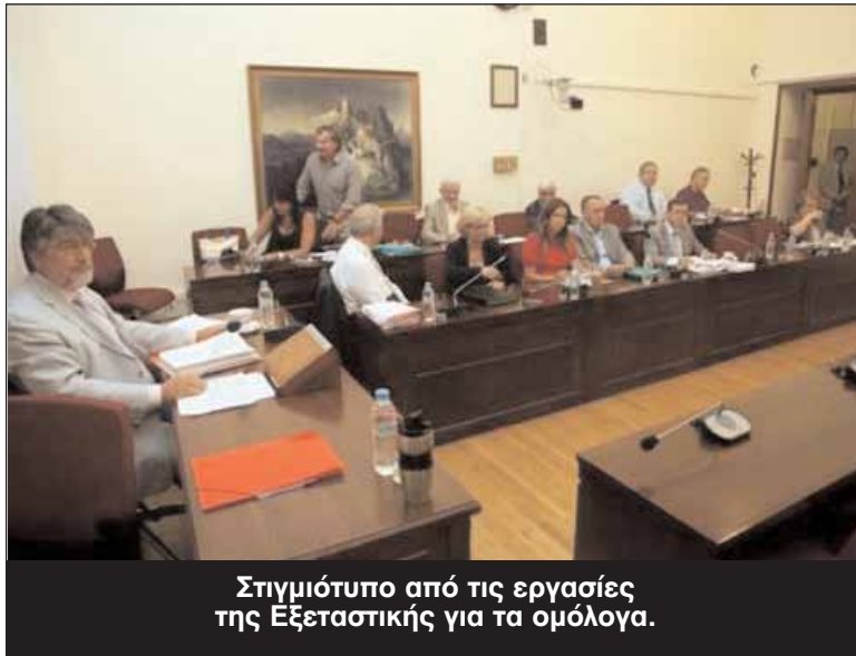
Στιγμιότυπο από τις εργασίες της Εξεταστικής για τα ομόλογα.

Το ΠΑΣΟΚ μάλιστα γνωστοποίησε δύο σχετι-