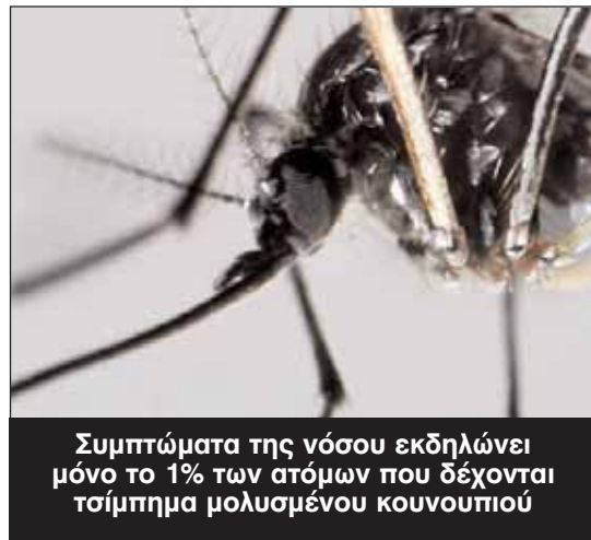
Συμπτώματα της νόσου εκδηλώνει μόνο το 1% των ατόμων που δέχονται τσίμπημα μολυσμένου κουνουπιού

Το αίτημα υποβλήθηκε επίσης στα υπουρ-γεία Υγείας και Οικονομικών.