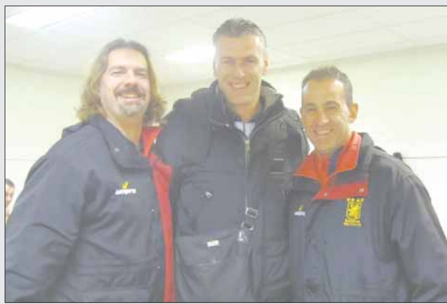
ΠΑΠΟΥΤΣΗΣ-ΤΣΕΚΕΝΗΣ και στην μέση η «Αράχνη» που ποιος ξέρει μπορεί να «πουλήσει» τον Σαμ τον Κρόατη και να «αραχνιάσει» ο Ζέλκο Κάλιτς, τα γκολπόστ του Σίδνεϊ Ολύμπικ. Οι δύο Πίτερς ως γνωστόν είναι και τα πρώτα «ψηστήρια».

πόν από την «τυπική διαδικασία» που άδει ο αιδός Πασχάλης Τερζής, «η τυπική διαδικασία» των υπογραφών ή όπως λένε τα αυστράλγια όλα θα είναι «οκ» και στο «επίσημο» όταν θα πέσουν οι υπογραφές στο χαρτί, κοινώς ... «pen to paper».