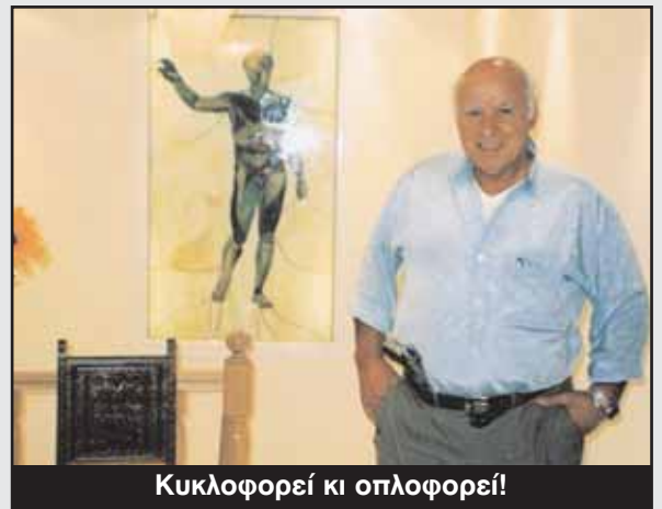
Κυκλοφορεί κι οπλοφορεί!

νας αθλητής είναι ο Πύρρος Δήμας, του αρέσει το ελληνικό φαγητό, ο Στράτος Διονυσίου και θα ήθελε να συναντήσει κάποτε τον Μοχάμεντ Άλι. Στον αθλητισμό απεχθάνεται το ντοπάρισμα, ενώ θεωρεί καλύτερους φίλους του τους δύο γιους του, Στρατή και Στέλιο.