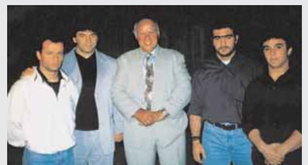
Με τους Έλληνες πρωταθλητές της άρσης βαρών, το 2000 στο Σίδνεϊ.