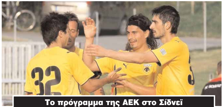
Το πρόγραμμα της ΑΕΚ στο Σίδνεϊ

Αυτό είναι το επίσημο πρόγραμμα της ΑΕΚ στο τετραεθνές τουρνουά του Σίδνεϊ, στο οποίο συμμετέχουν ακόμη η οικοδέσποινα Σίδνεϊ FC, η Μπλάκμπερν κι η Γκλάσγκοου Ρέιντζερς.