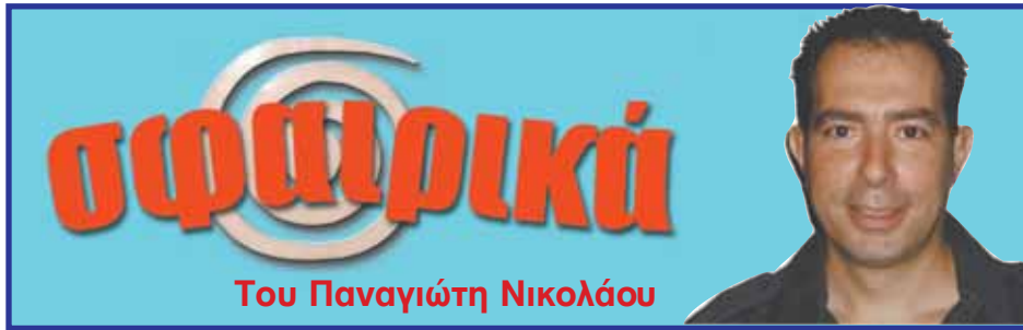
Του Παναγιώτη Νικολάου

Πληροφορούμαστε πως εκατοντάδες Ελλήνων φιλάθλων θα βρεθούν την Παρασκευή στο αεροδρόμιο για να υποδεχθούν την αποστολή της ΑΕΚ στο Σίδνεϊ. Αρκετοί είναι οι φίλαθλοι που θα έλθουν στην πόλη μας από άλλες περιοχές της Αυστραλίας για να καλωσορίσουν στο αεροδρό-