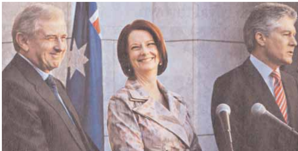
Ο υπουργός Παιδείας, Σάιμον Κριν, με την Τζούλια Γκίλαρντ και τον υπουργό Εξωτερικών, Στίβεν Σμιθ.

Πάντως, όλα θα εξαρτηθούν από το πόσο θα κρατήσει η πρωτοπορεία της κυβέρνησης στις δημοσκοπήσεις. Υπενθυμίζεται ότι σε πρόσφατη δημοσκόπηση το Εργατικό Κόμμα προηγεί-