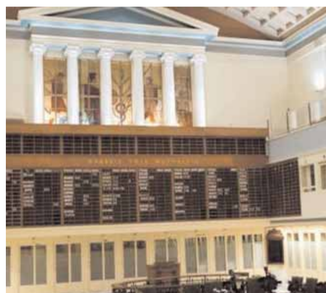
Η παλιά αίθουσα του Χρηματιστηρίου στη Σοφοκλέους