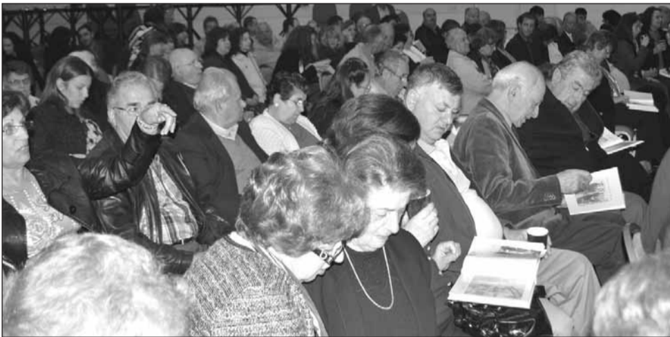
Κατάμεστη από κόσμο η αίθουσα της Μυτιληνιακής Αδελφότητας στο Κάντερμπερι