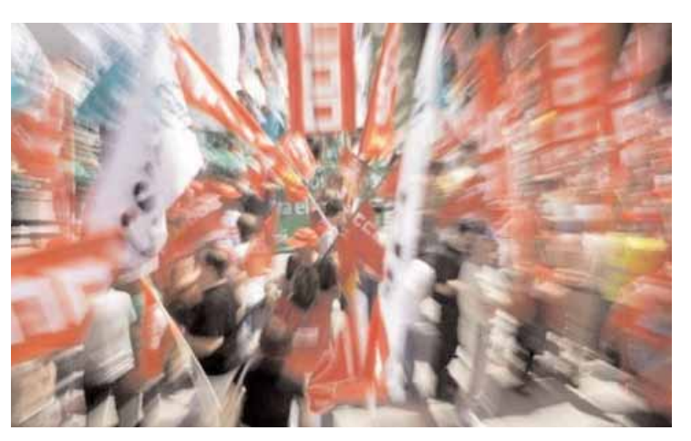
Μαζικά στους δρόμους οι Ισπανοί

ταία 30 χρόνια που γίνεται περικοπή στις αποδοχές των εργαζομένων του δημόσιου τομέα στην Ισπανία.