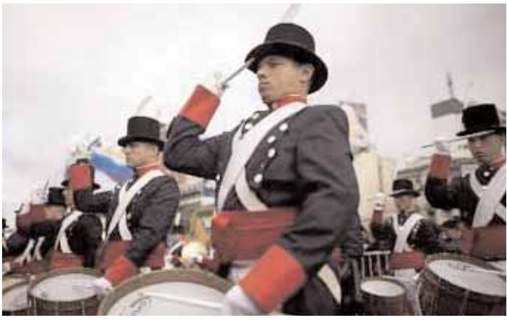
Από τη μεγαλειώδη παρέλαση στο Μπουένος Αϊρες