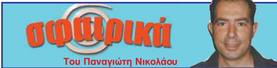
Του Παναγιώτη Νικολαΐου

Πέμπτη 24 Ιουνίου 04:30 ΑΥΣΤΡΑΛΙΑ-Σερβία