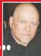
Του Γιώργου Σταυρουλάκη