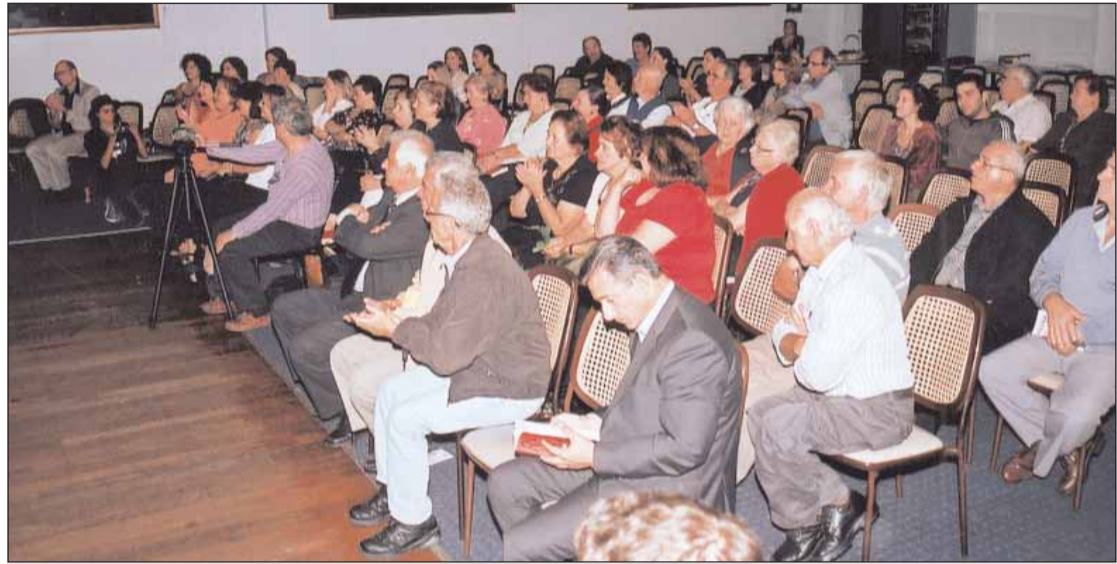
Άποψη του ακροατηρίου

Το 28ο Ελληνικό Φεστιβάλ του Σίδνεϊ παρουσίασε το βιβλίο του συγγραφέα Τζων Δανάλη “Καβάλα στο μαύρο παπαγάλο” την περασμένη Τετάρτη 14 Απριλίου, στην Ελληνική Κοινοτική Λέσχη. Στην παρουσίαση μίλησε ο Τζων Δανάλης καθώς και ο αυτόχθονας καλλιτέχνης Ρίτσαρντ Γκρην. Ακολουθούν στιγμιότυπα από την παρουσίαση του βιβλίου.