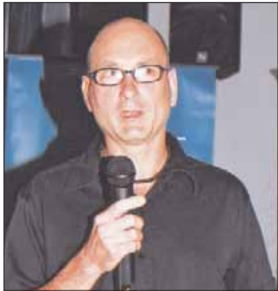
Ο συγγραφέας Τζων Δανάλης