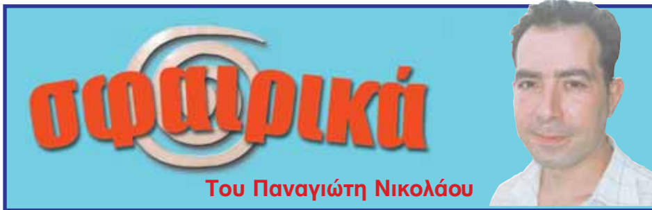
Του Παναγιώτη Νικολαίου

Πολλοί είναι οι ποδοσφαιριστές που θα απουσιάσουν από το φιλικό της Κυριακής. Το Σίδνεϊ Ολύμπικ αντιμετωπίζει αρκετά προβλήματα τραυματισμών και θα στερηθεί τις υ-