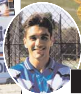
Ενας Καρτόζο απ' τα παλιά...

« Πιστεύω ότι οι φιλάθλοι του Ολύμπικ θα γεμίσουν τις κερκίδες του Μπέλιμορ και θα βοηθήσουν την προσπάθεια της διοίκησης, που κάνει ότι μπορεί για να φτιάξει ομάδα που θα πρωταγωνιστήσει. Εγώ θα προσπαθήσω να κάνω ότι μπορώ να βοηθήσω με την πείρα μου. Βέβαια δεν είμαι πλέον 25 ετών και το τρέξιμο θα το αφήσω για τα νέα παιδιά, που θα αναλάβουν να γεμίζουν το γήπεδο με την παρουσία τους. Δική μου δουλειά είναι να δίνω έτοιμα γκολ στους συμπαίχτες μου και να βρίσκω τα αντίπαλα δίχτυα, μια τέχνη που δεν ξεχνιέται όσο και να περνά ο καιρός »