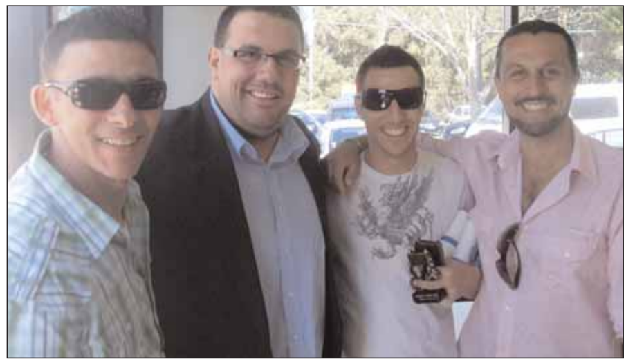
Μπέρις και...τόπο στα νιάτα για την Ελληνική ομάδα, που «κάποιοι» με ονοματεπώνυμο προσπαθούν να την ιδιωτικοποιήσουν και να την απομονώσουν από την Ελληνική παροικία. Ας ελπίσουμε ότι αυτοί που κάθονται στις «μεγάλες καρέκλες» της διοίκησης της ομάδας, το 2010 θα αναλάβουν τις ευθύνες τους και θα πάψουν να είναι πλέον τα «υπάκουα» παλικάρια του οπισθοδρομικού παρασκήνιου που κρατά τον Σύλλογο στην απομόνωση για δυο δεκαετίες...και βάλει!!

☛ ...μιας προσπάθειας που οι κόποι ανταμειφθηκαν με τον καλύτερο τρόπο, αρχικά από όλους εσάς τους αναγνώστες του ΚΟΣΜΟΥ, αλλά και από την ανώτερη ποδοσφαιρική αρχή του ποδοσφαίρου της ΝΝΟ, που για πρώτη φορά στην τριαντάχρονη ιστορία της, βραβεύει προσπάθεια μη αγ-