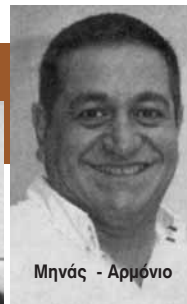
Μηνάς - Αρμόνιο