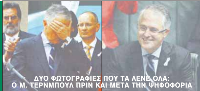
ΔΥΟ ΦΩΤΟΓΡΑΦΙΕΣ ΠΟΥ ΤΑ ΛΕΝΕ ΟΛΑ: Ο Μ. ΤΕΡΝΜΠΟΥΛ ΠΡΙΝ ΚΑΙ ΜΕΤΑ ΤΗΝ ΨΗΦΟΦΟΡΙΑ

A New Home for Treasures of the Acropolis