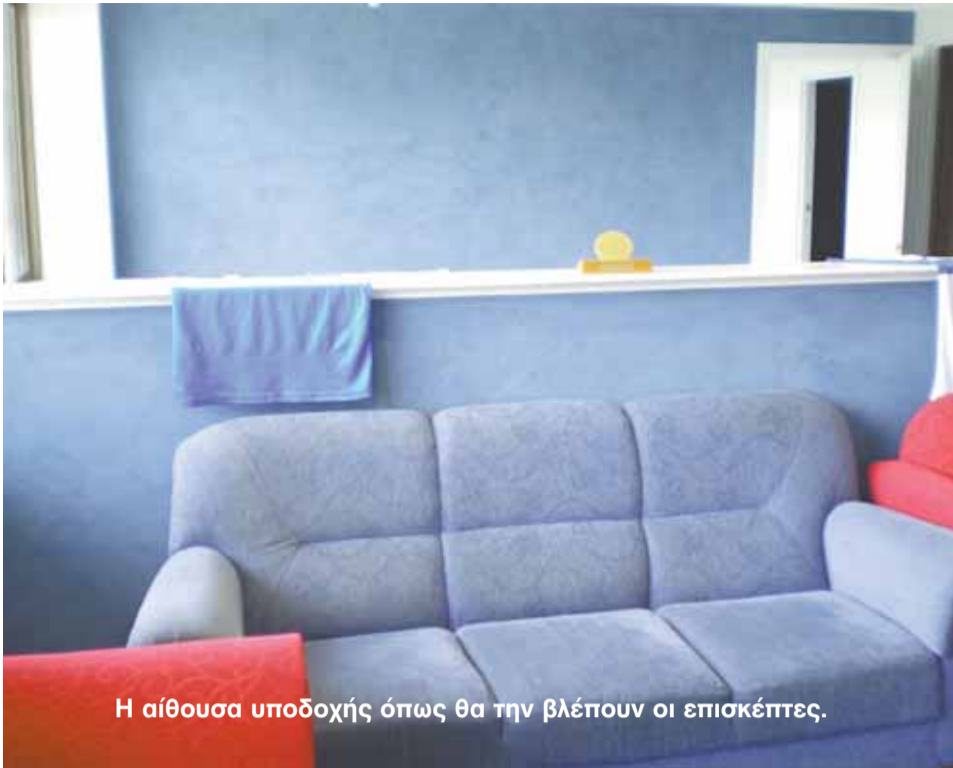
Η αίθουσα υποδοχής όπως θα την βλέπουν οι επισκέπτες.