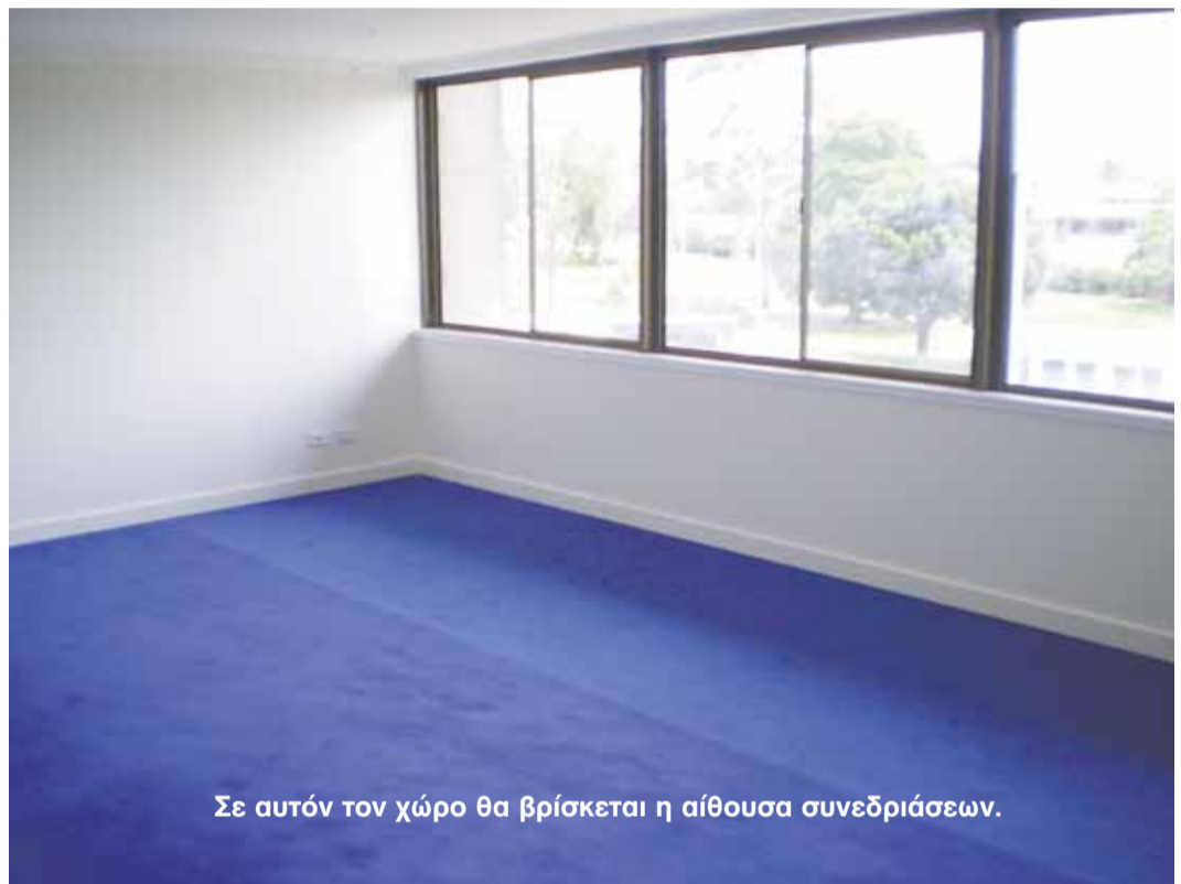
Σε αυτόν τον χώρο θα βρίσκεται η αίθουσα συνεδριάσεων.

Επίσης, ακριβώς κάτω από τα γραφεία, στην κεντρική είσοδο των εξέδρων (στον χώρο που κάποτε ήταν το μπαρ) θα δημιουργηθεί καφενείο για τους φιλάθλους.