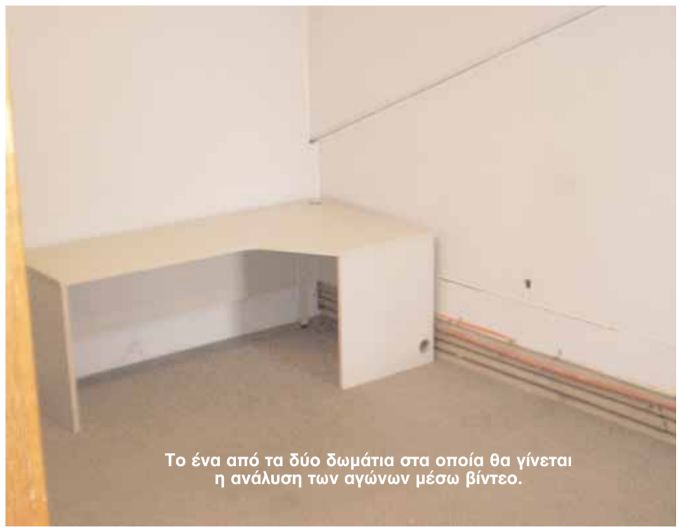
Το ένα από τα δύο δωμάτια στα οποία θα γίνεται η ανάλυση των αγώνων μέσω βίντεο.