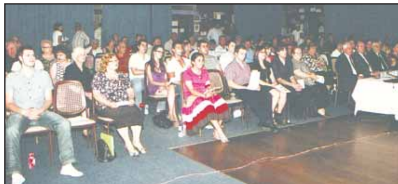
Άποψη του ακοατηρίου.