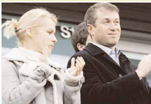
Το δεξί χέρι του Ρομάν Αμπράμοβιτς θα είναι ο νέος πρόεδρος της Ποδοσφαιρικής Ομοσπονδίας της Ρωσίας.

Η γενική είσοδος καθορίστηκε στα 15 ευρώ, τα μαθητικά 5 ευρώ και το παιδικό 1 ευρώ.