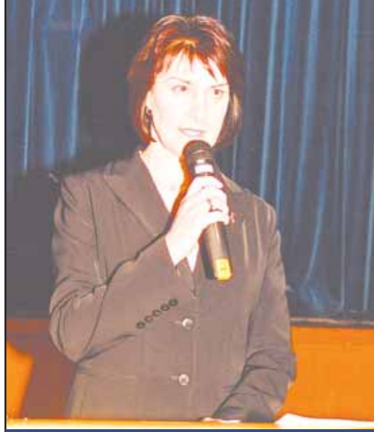
The Hon Carmel Tebbutt MP (Deputy Premier & Minister for Health)