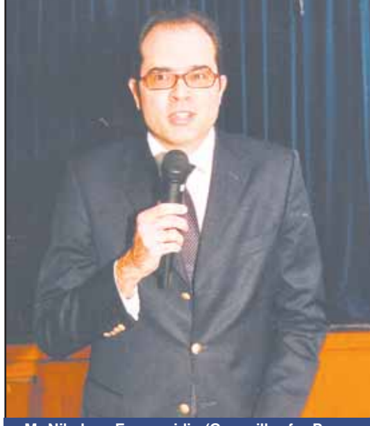
Mr Nikolaos Economidis (Councillor for Press & Consulate General of Greece in Sydney)