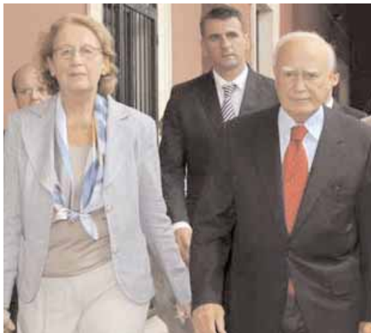
Ο Πρόεδρος Κάρολος Παπούλιας με τη σύζυγό του Μαΐη

Θετικά απαντά ο Κάρολος Παπούλιας στο θέμα της επανεκλογής του για δεύτερη θητεία (2010-2015) στην προεδρία της Ελληνικής Δημοκρατίας.