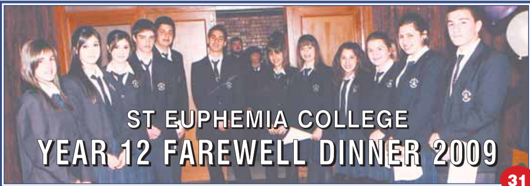
ST EUPHEMIA COLLEGE YEAR 12 FAREWELL DINNER 2009