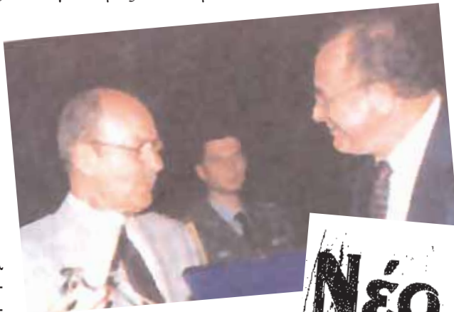
Ο πρώην πρόεδρος της Ελληνικής Δημοκρατίας Κ. Κωνσταντίνος Στεφανόπουλος με τον Θήο Σκάλκο

Στο μεταξύ, εγώ ένοιωθα άβολα στο "Βήμα" και άρχισαν οι αψιμαχίες με τον Αρώνη, ο οποίος είχε αγγλοσαξωνική νοοτροπία και δεν μπορούσαμε να κάνουμε έναν ελληνοπρεπές καννά όπως με τον Θήο Σκάλκο. Υστερα από μια τέτοια αψιμαχία παρατηρήθηκε από το "Βήμα" και απηυδισμένος σκόπευα να επιστρέψω στο αγγλόφωνο Τύπο. Όμως μόλις ο Θήο έμαθε ότι έφυγα από το "Βήμα" μου πρότεινε να επιστρέψω για να εργαστώ στη στοιχειοθεσία αγ-