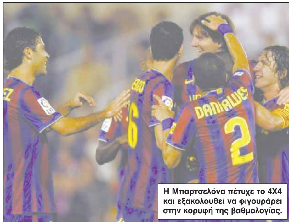
Η Μπαρτσελόνα πέτυχε το 4X4 και εξακολουθεί να φιγουράρει στην κορυφή της βαθμολογίας.

στην εφειτηνή Πριμέρα Ντιβιζιόν. Στο πρώτο χρονικά παιχνίδι της αγωνιστικής, η ομάδα του Μανόλο Χιμένεθ επικράτησε με 2-0 στο «Σάντσεθ Πιθχουάν» και έφτασε τους εννέα βαθμούς. Για τους Ανδαλουσιανούς σκόραραν οι Σκιλασί (17') και Περότι (25').