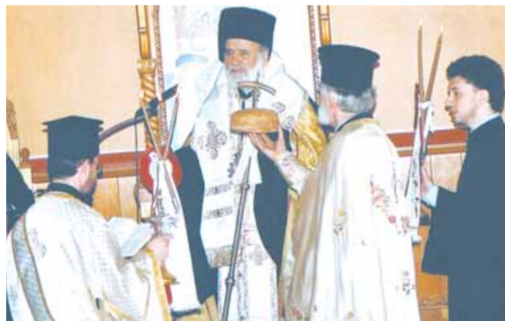
Στιγμιότυπο από την αρτοκλασία