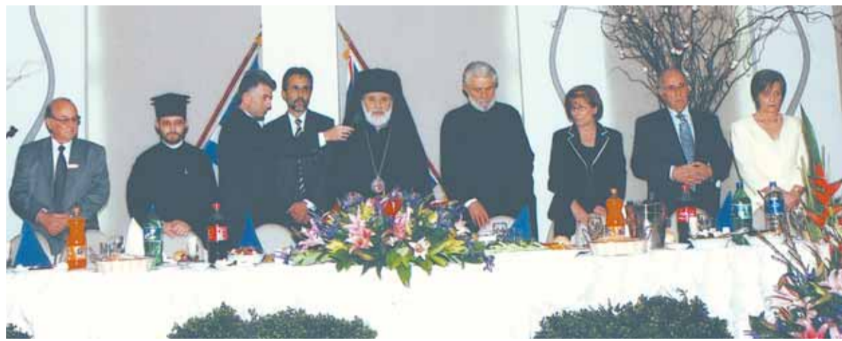
Το επίσημο τραπέζι