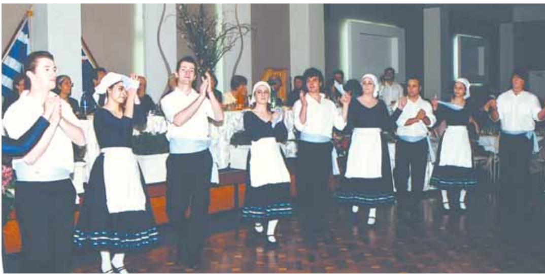
Το χορευτικό συγκρότημα της Κοινότητας