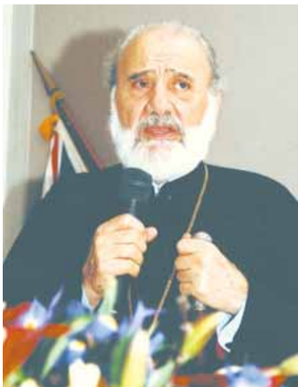
Σεβασμιώτατος Αρχιεπίσκοπος Αυστραλίας κ.κ. Στυλιανός

ποίηση, βήμα προς βήμα, την υποδειγματική πρόοδο της Ενορίας και Κοινότητας Λίβερπουλ και έζησαν από κοντά τα επιτεύγματα - σταθμούς στην μέχρι σήμερα σαραντάχρονη πορεία της.