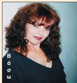
Β Α Σ Α