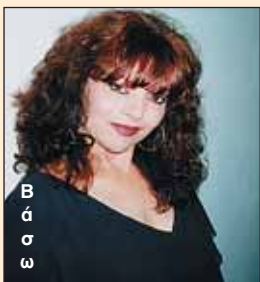
Β α σ α