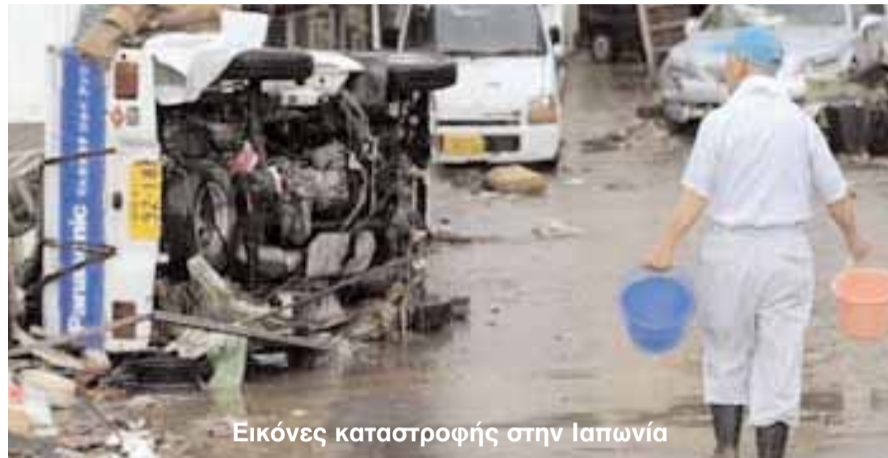
Εικόνες καταστροφής στην Ιαπωνία

Τόκιο. - Για 12 νεκρούς και εννέα αγνοούμενους από τις βροχές-προάγγελους του τυφώνα Ετάου κάνουν λόγο οι Αρχές της Ιαπωνίας, καλώντας 50.000 ανθρώπους να εγκαταλείψουν τις εστίες τους. Μαζική εκκένωση και τεράστιες καταστροφές από τον τυφώνα Μορακότ στην Κίνα. Φόβοι για 600 νεκρούς χωρικούς στην Ταϊβάν. Θύματα μετρά και η Ινδία.