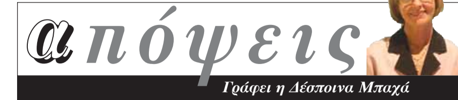
Γράφει η Δέσποινα Μπαχά

ΤΟ ΚΕΝΤΡΙΚΟ αίτημα της Επανάστασης ήταν η πολιτική ελευθερία και τα πολιτικά δικαιώματα για όλους τους πολίτες και οι εξουσίες να ασκούνται σύμφωνα με τους νόμους. Γιατί πριν τη Γαλλική Επανάσταση η