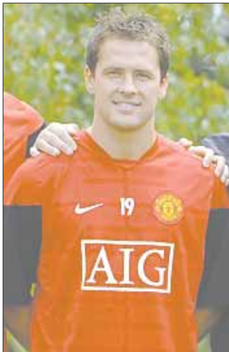
Ο Σερ Άλεξ με τους Ομπερτάν, Όουεν και Βαλένσια.

Την ώρα που ο σερ Άλεξ Φέργκιουσον έχριζε με κάθε επισημότητα τον Μάικλ Όουεν ως τον αντικαταστάτη του Κριστιάνο Ρονάλντο, ο Σκοτσέζος έκανε και τις πρώτες του δηλώσεις αισιοδοξίας για την εποχή που ξεκινά στους «διάβολους» χωρίς τον Πορτογάλο σταρ. Ο πολυνίκης τεχνικός δείχνοντας έμπρακτα την εκτίμηση που τρέφει προς το πρόσωπο του έμπειρου Άγγλου νεοφερμένου στο «Ολντ Τράφορντ» επιθετικού, του έδωσε για τη νέα σεζόν τη φανέλα με τον αριθμό «7», εκείνη που το ίδιο γρήγορα είχε προσφέρει στον Κριστιάνο Ρονάλντο όταν 18 ετών ακόμα είχε μετεγγραφεί από την Σπόρτινγκ