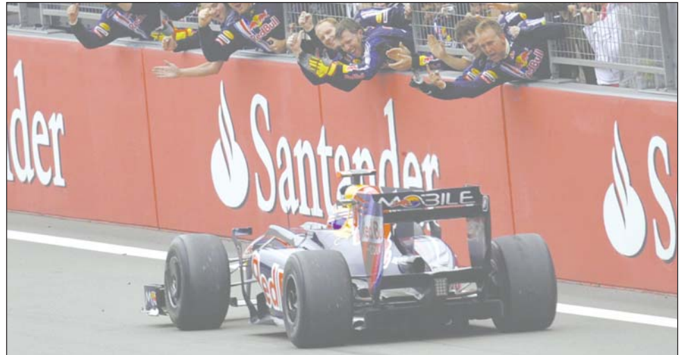
Ο Ουέμπερ τα... κατάφερε και πανηγύρισε την πρώτη νίκη της καριέρας του έπειτα από 132 γκραν πρι.

Ο Mark Webber τα κατάφερε. Κόντρα σε ατυχίες, τραυματισμούς αλλά και... τιμωρίες, ο Αυστραλός έφτασε στην πρώτη νίκη της καριέρας του στη Formula 1, τερματίζοντας πρώτος στο γερμανικό grand prix στην πίστα του Nurburgring. Ήταν η τρίτη φετινή νίκη για τη Red Bull έπειτα απ' αυτές του Sebastien Vettel σε Σαγκάη και Silverstone, και φυσικά την πανηγύρισε έξαλλα ο Webber, ο οποίος περίμενε... 132 αγώνες στο κορυφαίο πρωτάθλημα μηχανοκίνητων σπορ για να ανέβει στο ψηλότερο σκαλί του βάρου. Δεύτερος τερμάτισε ο Vettel, ολοκληρώνοντας ακόμα έναν φανταστικό αγώνα για τη Red Bull, ενώ το βάθρο συμπλήρωσε ο Felipe Massa, ο οποίος έκανε αλάνθαστο αγώνα, κέρδισε πέντε θέσεις σε σχέση με την εκκίνηση και τελικά πήρε μια πολύ σπουδαία τρίτη θέση. Πολύ καλή εμφάνιση και τέταρτη θέση για τον Nico Rosberg με την Williams, ακολούθησαν στην πέμπτη κι έκτη θέση οι δύο Brawn GP των Jenson Button και Rubens Barrichello, ο Fernando Alonso με τη Renault τερμάτισε έβδομος, ενώ τη βαθμολογούμενη οκτάδα συμπλήρωσε ο Heikki Kovalainen που... έσωσε το γόητρο της McLaren.