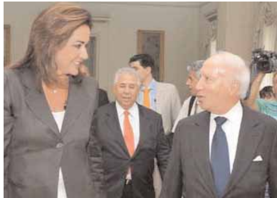
Η Ντόρα Μπακογιάννη με τον Μάθιου Νίμιτς

Με την υπουργό Εξωτερικών, Ντόρα Μπακογιάννη, συναντήθηκε το μεσημέρι της Τετάρτης ο Μάθιου Νίμιτς με κύριο στόχο την αναθέρμανση της διαδικασίας για την εξεύρεση αμοιβαία αποδεκτής λύσης στο θέμα της ονομασίας της ΠΓΔΜ.