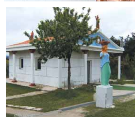
Οπισθία άποψη του ναού (πριν αρχίσουν οι εργασίες ανακατασκευής).