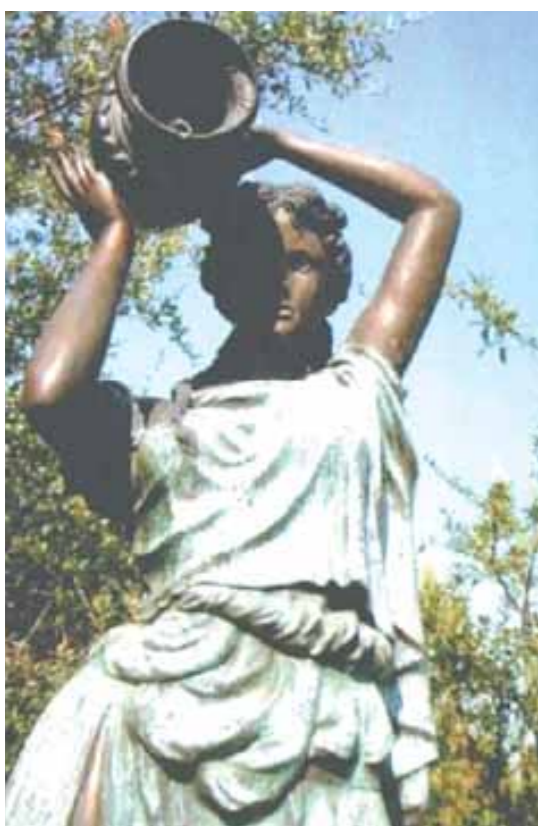
Χάλκινο επίσης είναι το άγαλμα της Τροφού, ύψους 1,90 μ. Μια όμορφη νεαρή και δυναμική γυναίκα που κρατάει ένα δοχείο απ' το οποίο ρέει συμβολικά το νέκταρ.