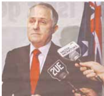
ΑΡΙΣΤΕΡΑ, Ο αρχηγός της αντιπολίτευσης, Μάλκολμ Τέρνμπουλ και ΔΕΞΙΑ, Ο Θησαυροφύλακας, Γουέιν Σουάν

Στη Βουλή χθες, ο αρχηγός της αξιωματικής αντιπολίτευσης, Μάλκολμ Τέρνμπουλ, εστίασε την επίθεσή του μόνο στον Θησαυροφυλάκα, Γουέιν Σουάν, με μακρά και παθιασμένη ομιλία