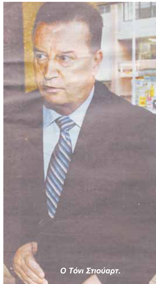
Ο Τόνι Στιούαρτ.

Η αναφορά τής κας Ρόναλντς γύρω από τις καταγγελίες ήταν η βάση τής απόλυσής τους, επειδή η μπάριστερ πίστεψε την κα Σάνγκερ. Ο κ. Στιούαρτ ισχυρίζεται ότι δεν του δόθηκε η ευκαιρία να υπερασπιστεί τον εαυτό του και η αναφορά τής κας Ρόναλντς ήταν ατελής. Η The Daily Telegraph έχει ήδη γράψει ότι ο υπουργός Υγείας, Τζον Ντέλα Μπόσκα, είχε προειδοποιήσει τον πρόμιερ ότι η υπόθεση θα έχει εξέλξει αν ο κ. Στιούαρτ απολυθεί με βάση την αναφορά τής κας Ρόναλντς.