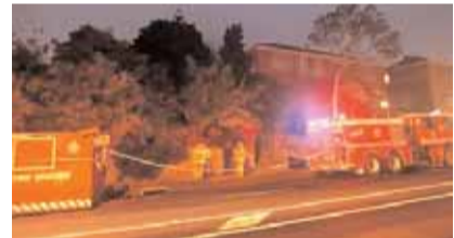
Φωτογραφία από την πυρκαγιά στο σπίτι της Τζούντι Μοράν.

Η Μοράν επρόκειτο να προσαχθεί σε δικαστήριο χθες.