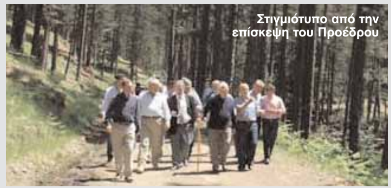
Στιγμιότυπο από την επίσκεψη του Προέδρου

Επικαλείται, τέλος, ότι δεν μπορεί να δικαστεί δύο φορές από το Συνοδικό Δικαστήριο για το ίδιο αδίκημα και πολύ περισσότερο όταν πριν από την απόφαση καθαίρεσης το Συνοδικό Δικαστήριο για το ίδιο αδίκημα είχε θέσει την υπόθεση στο αρχείο κατά πλειοψηφία.