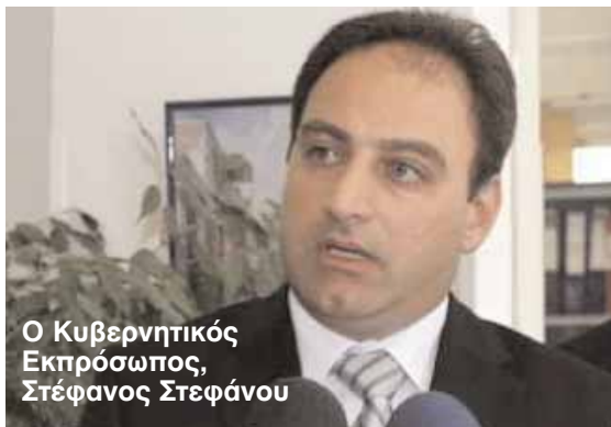
Ο Κυβερνητικός Εκπρόσωπος, Στέφανος Στεφάνου

εκλογές δεν είναι εθνικές εκλογές, στην προεκλογική εκστρατεία η πολιτική του Προέδρου και της Κυβέρνησης, τόσο στο Κυπριακό όσο και στην εσωτερική διακυβέρνηση, δέχθηκε σκληρή κριτική", είπε ο κ. Στεφάνου και πρόσθεσε: "Θεωρούμε λοιπόν ότι τα αποτελέσματα των εκλογών αποτελούν δικαίωση της πολιτικής της Κυβέρνησης".