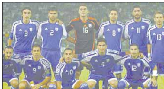
Η Κύπρος προηγήθηκε με 2-0 αλλά δεν μπόρεσε να νικήσει το Μαυροβούνιο