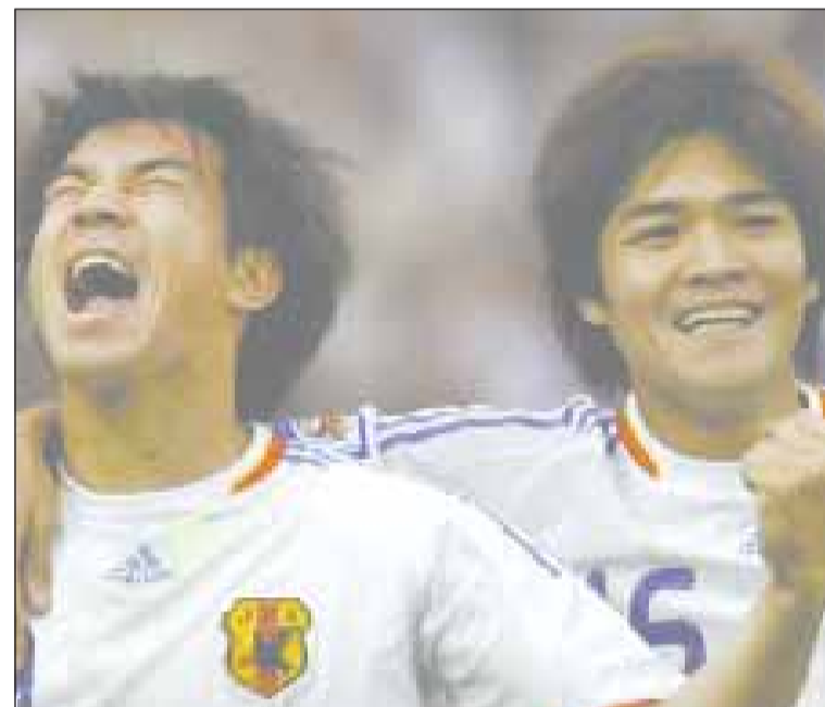
Η Ιαπωνία ήταν η πρώτη χώρα που πανηγύρισε την πρόκριση στο μουντιάλ της Νοτίου Αφρικής.