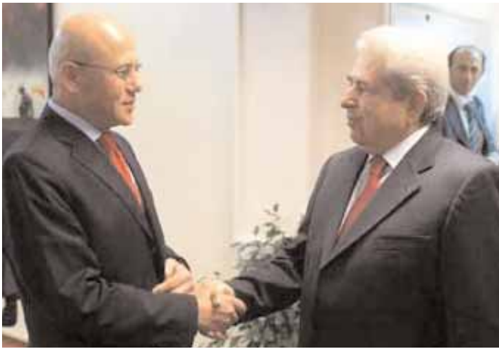
Από την συνάντηση Χριστόφια-Ταλάτ

Στις 11 Ιουνίου ξεκινούν τη συζήτηση για την εδαφική πτυχή του Κυπριακού ο Πρόεδρος της Κυπριακής Δημοκρατίας, Δημήτρης Χριστόφιας και ο Τουρκοκύπριος ηγέτης, Μεχμέτ Αλί Ταλάτ, όπως ανακοίνωσε ο ειδικός σύμβουλος του ΓΓ του ΟΗΕ, Αλεξάντερ Ντάουνερ μετά τη συνάντηση που είχαν οι δύο ηγέτες την Τετάρτη.