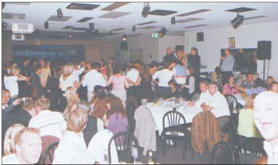
Άποψη του κόσμου από το Λήμνος κλαμπ.