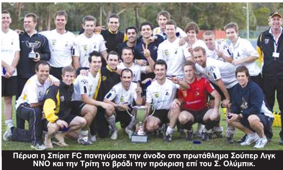
Πέρυσι η Σπίριτ FC πανηγύρισε την άνοδο στο πρωτάθλημα Σούπερ Λιγκ NNO και την Τρίτη το βράδι την πρόκριση επί του Σ. Ολύμπικ.