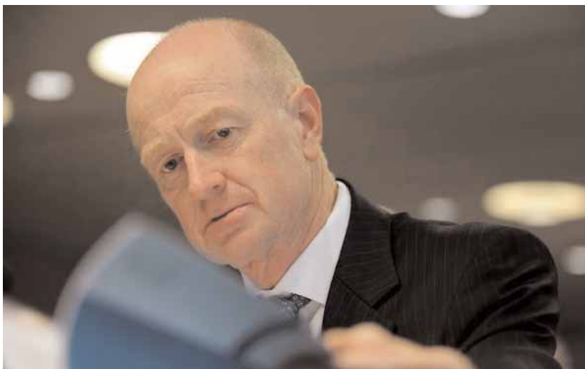
Ο κυβερνήτης της κεντρικής τράπεζας, Γκλεν Στίβενς

Από την πτώση στα επιτόκια σε στεγαστικά δάνεια οι δόσεις για δάνειο $400.000 έχουν μειωθεί κατά $1000 τον μήνα.