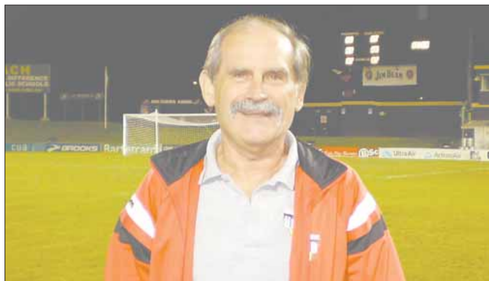
Ο ιδιοκτήτης του Πένριθ φιλοδοξεί να βάλει την ομάδα του Πένριθ στο A-Λιγκ